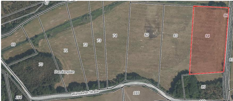
1: Mellensee, Flur 1, Flurstück 84