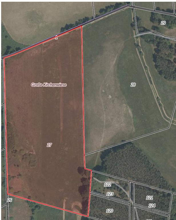
2: Wünsdorf, Flur 1, Flurstück 27